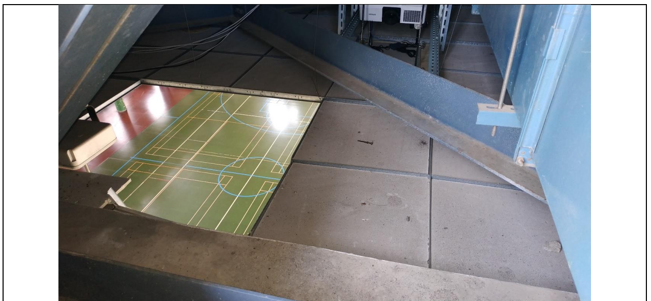
說明 照片 2：罹災者踏穿石膏板形成開口