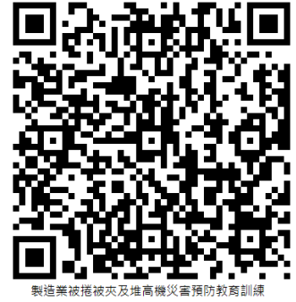
製造業被捲被夾及堆高機災害預防教育訓練