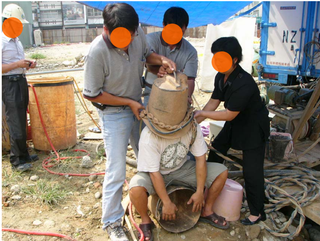
潛水鐘為頭罩式僅以潛水鐘重量罩在潛水者頭部，並以肩部支撐該潛水鐘之重量，且頭罩式之潛水鐘僅以重量壓在身體無任何和身體固定之設施，潛水作業時人員是坐在鐵桶，潛水鐘內無設視窗也無照明，故井內潛水作業完全在摸黑作業，因此頭罩式潛水鐘可能因外力造成脫落致罹災者溺水死亡。