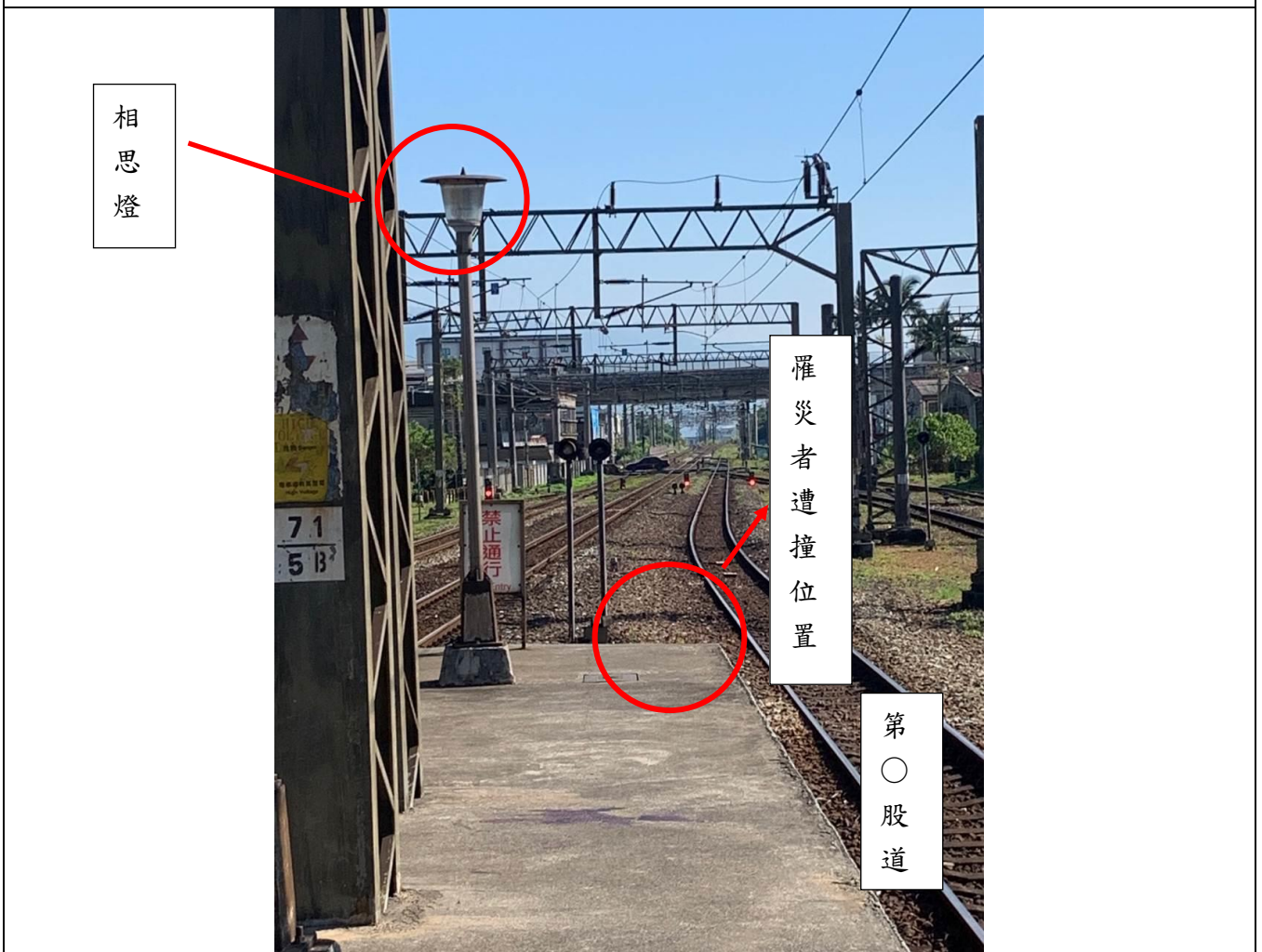
照片2 災害現場照片。