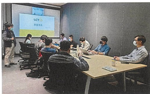
▲安全文化計畫推動