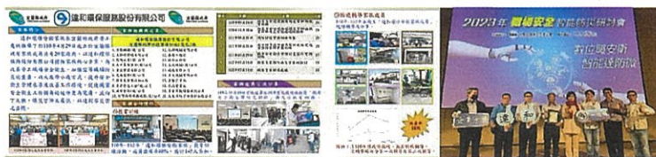
▲ 達和環保安衛家族執行成果及榮獲核心企業感謝狀