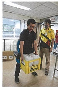
▲ 外骨骼肌力裝示範搬運重物