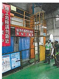
▲ 屋頂作業危害預防教學示範

建上工業對於安全最基本的觀念從教育訓練做起，因此建置專屬的安全衛生訓練室，包含作業者到高階主管及承攬商等之安全衛生教育訓練，在訓練教室內融入公司潛在之危害情境，導入實體體驗教學（包括感電、物體飛落、墜落、壓傷、捲夾等），有助於提升人員安全衛生意識與強化行為之安全，讓安全衛生觀念灌輸到每位員工身上。