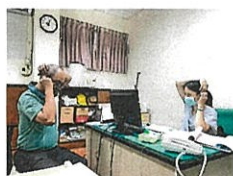
▲ 聽力保護教育訓練 (職醫)