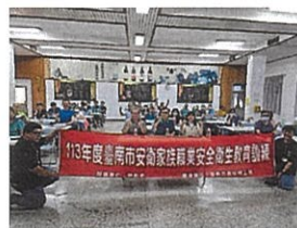
▲ 安衛家族職業安全衛生教育訓練