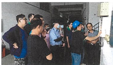
▲ 消防受信總機故障排除教育訓練

隆田酒廠通過 ISO9001 品質管理系統、ISO14001 環境管理系統、ISO22000 食品安全管理系統及 ISO45001/TOSHMS 國際（台灣）職業安全衛生管理系統等驗證，且酒品參加國際比賽屢獲佳績，如美國舊金山世界烈酒競賽 (SFWSC) 金牌獎、英國國際烈酒挑戰賽 (ISC) 雙金牌獎、英國國際葡萄酒暨烈酒競賽 (IWSC) 金牌獎、比利時世界品質評鑑大賞 (MONDE SELECTION) 金質獎及財政部優質認證酒品金牌獎等。