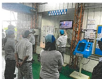
▲ 機械危害預防暨異常處置教育訓練