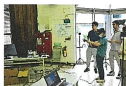
▲ VR 體驗教育訓練實況