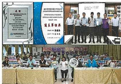
▲ 積極推動安全衛生管理制度全面提升安全績效