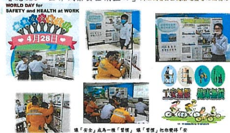
▲ 響應 428「世界職業安全衛生日」辦理職場安全健康週簽署活動情形