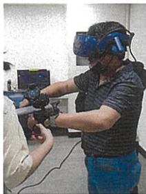
▲ 使用虛擬實境方式執行安全衛生教育訓練