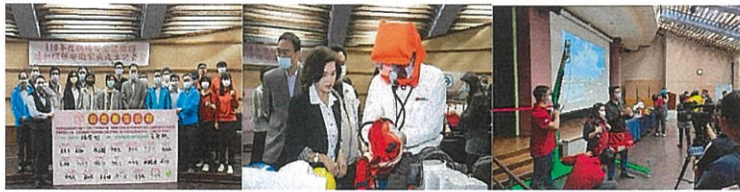
▲ 達和環保安衛家族成立記者會暨虛擬高空作業體驗及防護具配戴體驗活動