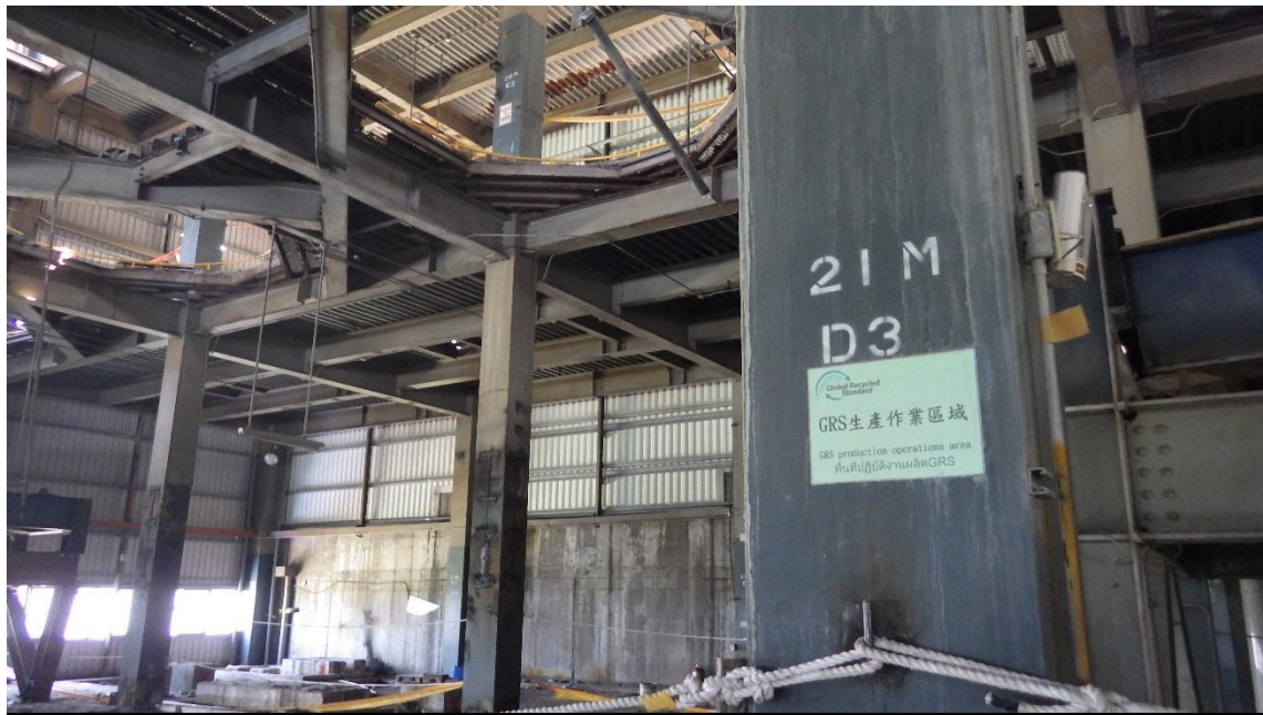
照片 1 災害現場照片，該廠房 4 樓樓板高度為 21 公尺。