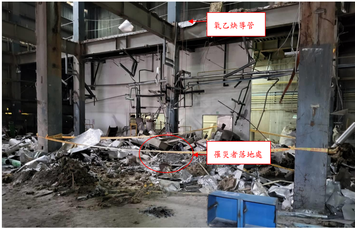
照片 3 於罹災者落地處有氧氣乙炔導管自廠房 4 樓垂落至 1 樓。