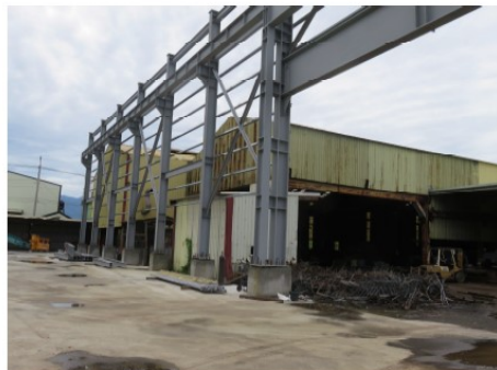
說明 照片 4： 災害發生時，現場南北面鋼構之梁柱大部分已組裝。