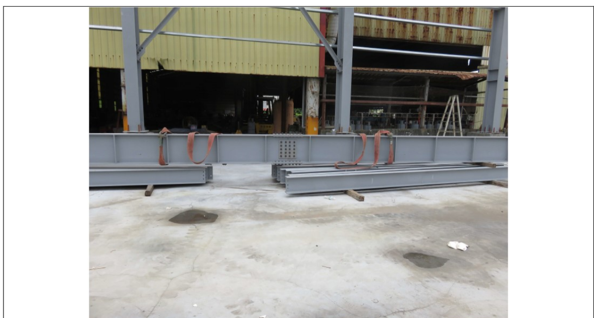
說明 照片 2：災害發生時，欲鎖固之 G1 梁總長度約 18.44 公尺，吊掛時採 2 點吊掛，2 掛吊點間距約 5 公尺。