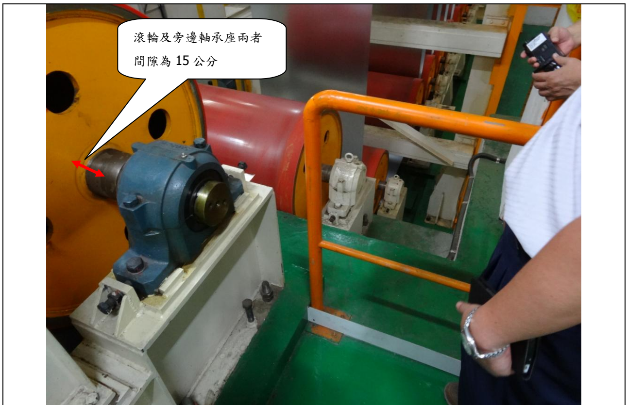
說明二 現場發現生產機組(如張力滾輪)有捲入危險，卻未設置護罩或護圍等設備，人員可以直接靠近