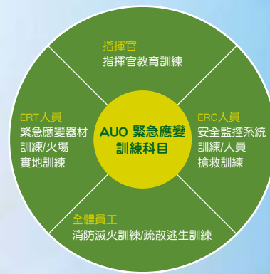
圖2 AUO緊急應變訓練科目

友達光電各廠區每年定期舉辦大型緊急應變演練，2007年度各廠區亦根據實際可能發生之意外事故，擬定各類事故應變演練計劃，並舉行大型事故應變演練。每季並進行第一時間應變演練，依實際事故應變結果或演練建議事項修正應變計劃，強化友達光電應變處理能力。如為大型災害，廠區無法獨自進行搶救，亦可啟動聯防機制，通報及請求鄰近友廠或主管機關協助進行災害搶救。