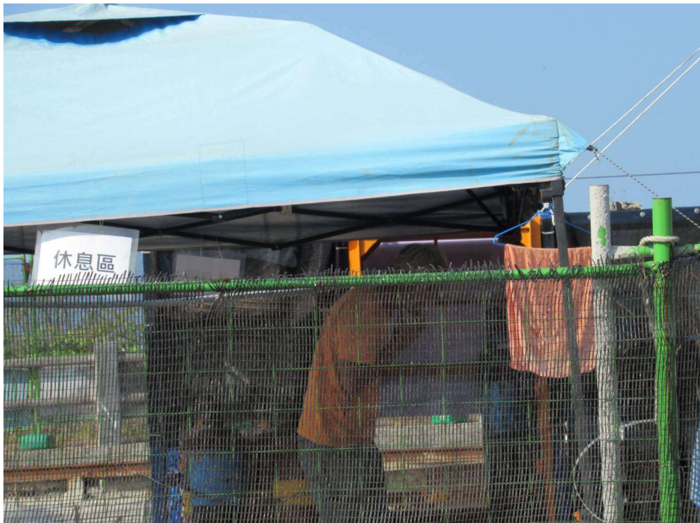
天然氣管線輸送系統工程施工廠商 WS08 工作井施工人員未戴安全帽