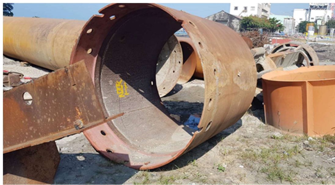
冷卻循環水系統施工廠商進水明渠全套管鋼管未設置擋樁