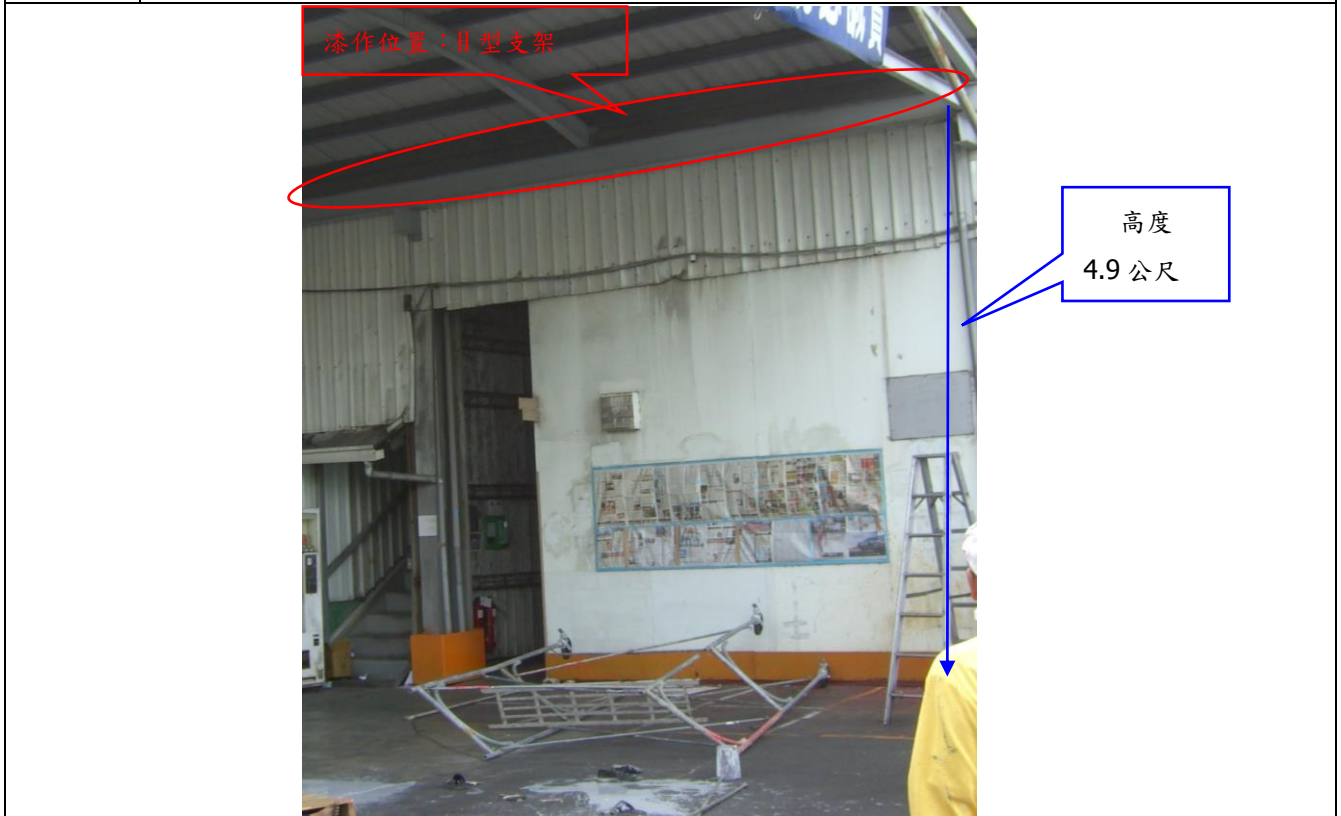
說明 照片 2：事發當時係在從事資材及物流辦公室外遮雨 H 型支架油漆作業，該支架距地面高度 4.9 公尺