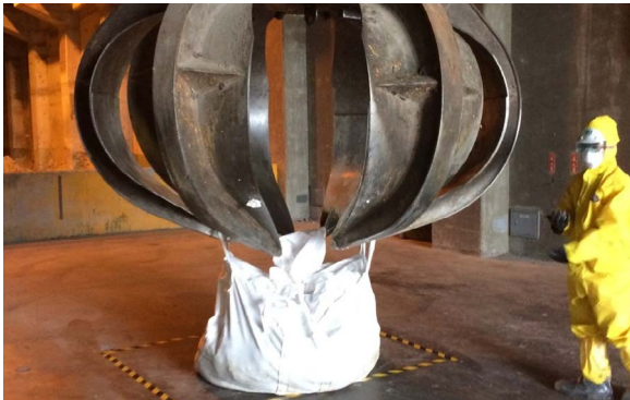
使用抓斗協助處理禽流感動物屍體