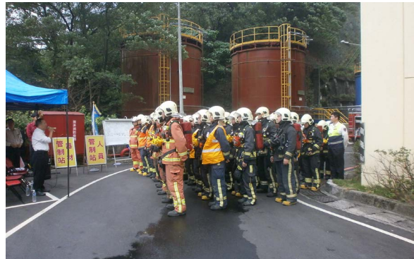
消防局與新店廠同仁演練集合情形