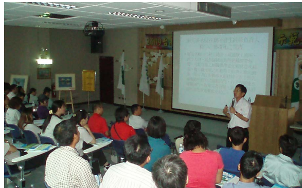
協助南區職安中心辦理安衛宣導會