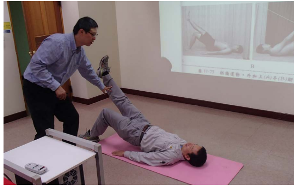
天主教聖馬爾定醫院物理治療師教導正確的舒展姿勢