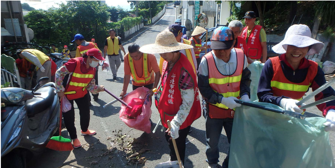
辦理「揪厝邊清掃家園」活動