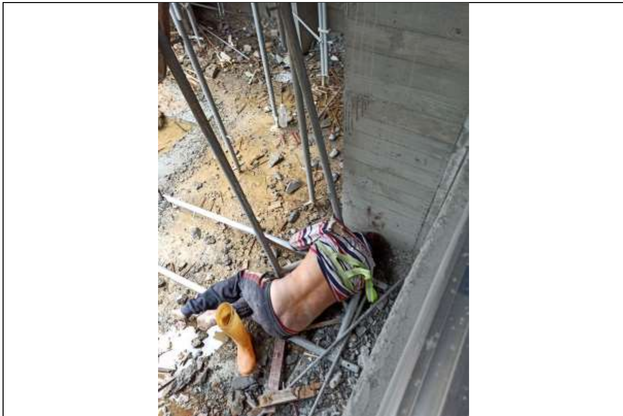
說明 照片二：目擊者於 1F 室內發現罹災者墜落地面，且未戴安全帽。