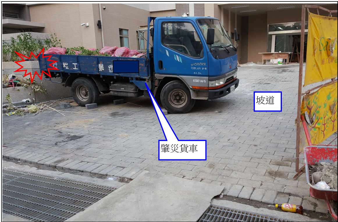
說明 附照：災害現場照片