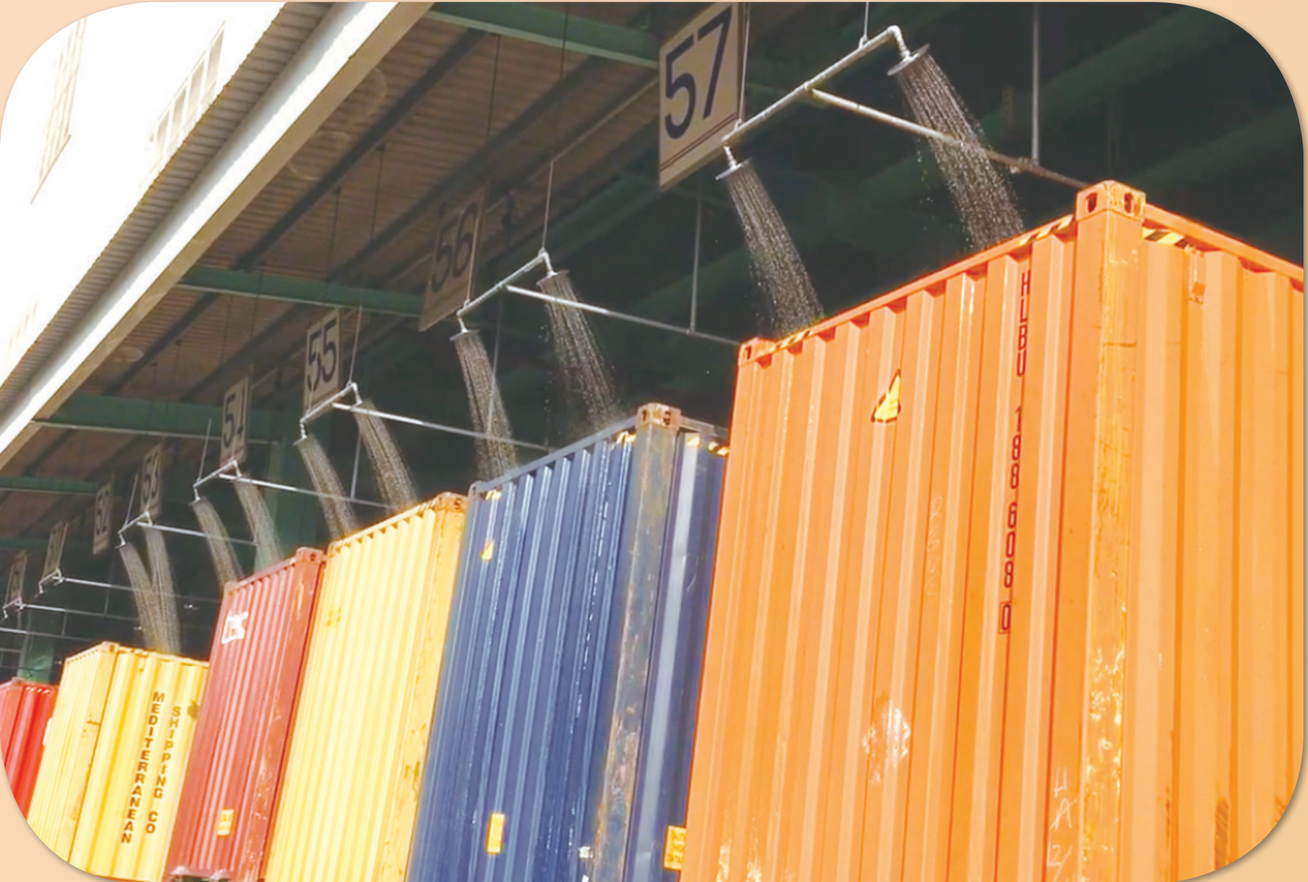
增設貨櫃灑水及通風換氣設備