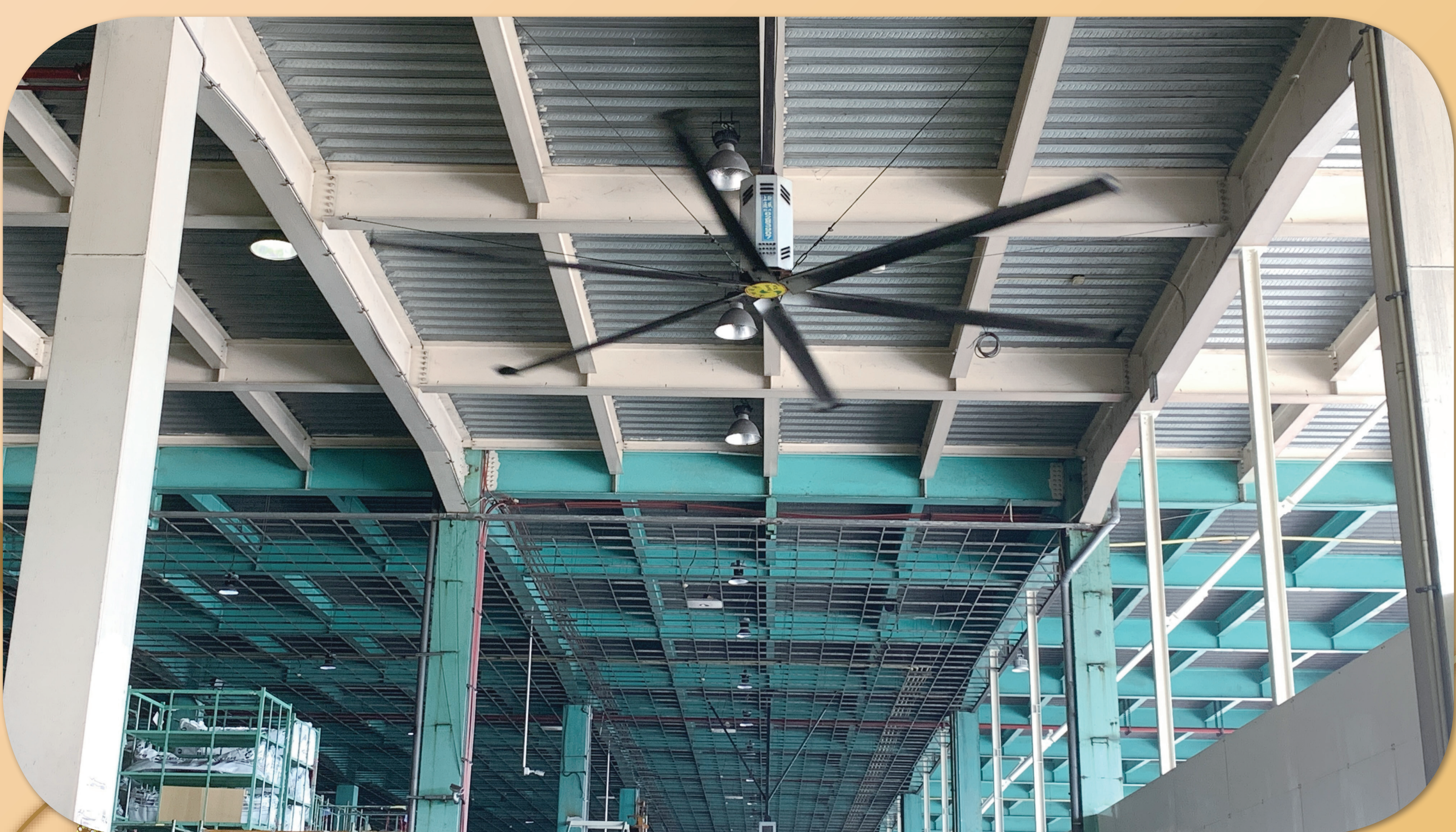
設置流力扇及 190 吋大吊扇