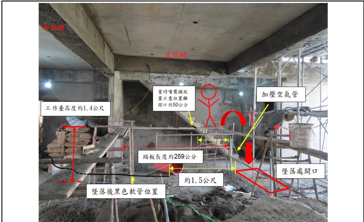
說明 災害模擬示意圖