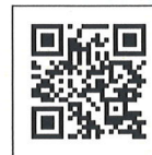
法務部 「More:法狀元」宣導網